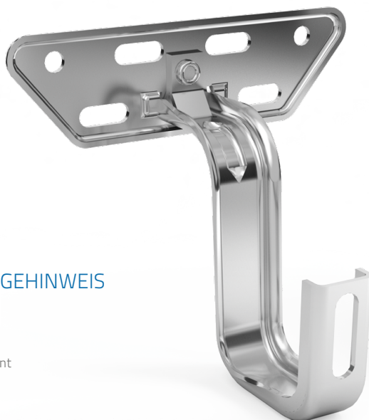
Dachhaken Optimo & Flash Cover Erdungsplättchen: Produktbilder zum Download in der Alumero Presselounge.